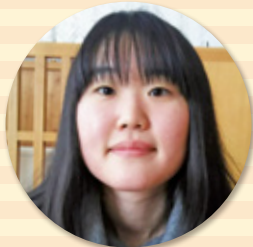
人間生活学部 保育学科 2年 O.Mさん