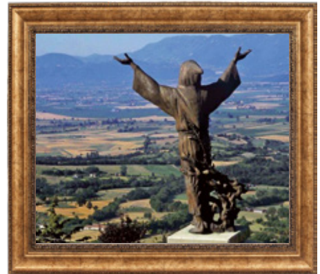
人々に向かって出かけるフランシスコ