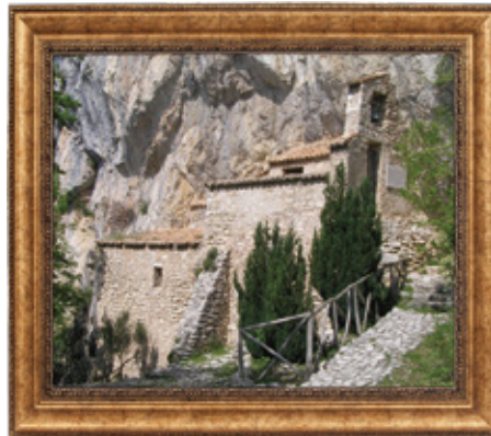
ポッジョ・ブストーネの隠遁所

このようにしてフランシスコは、修道生活の歴史において新しい形の修道会を始めました。聖ベネディクトに始まる従来の修道生活は、人里離れた修道院で共住の定住生活を送り、祈りの内に農耕生活や学問をしたりして自給自足の生活をしていました。一方、フランシスコは二人ずつ組んで至る所に出かけ、人々に平和と罪の赦しのための悔悛を宣べ伝え、托鉢しながら神の摂理に全く信頼して生きる生活を始めたのです。