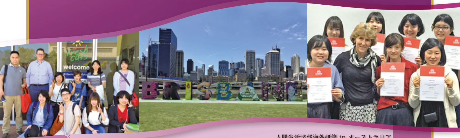
人間生活学部海外研修 in オーストラリア