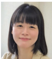
文学部 日本語・日本文学科 4年