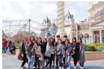
韓国の有名な遊園地エバーランドで、語学堂の仲間と

まず、勉学面について紹介します。午前中は語学堂という韓国語の授業を受け、午後は学部授業を履修しました。語学堂を受講して良かった点は様々な国の人と交流できたことです。私の教室では、台湾・中国・ベトナム・イタリアの人たちがいましたが、国別にその日のテーマに沿って韓国語で話すことが多く、韓国だけでなく他の国の文化に触れあう機会がたくさんありました。そのため、新しい発見をすることができ、視野の広がる良い経験だったと思います。また学部授業では、全体的に日本の授業よりも発表をする機会が多かったことがとても印象的でした。発表を通して、もっと上手にプレゼンをやってみたいという意欲も湧きました。