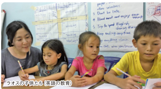
ラオスの子供たち(英語の教育)

質素な生活の中でも現地の人たち、そして子供たちも互いに支え合いながら暮らし、他人同士の距離の近さや人の優しさを強く感じました。フィリピンでは、現地の小学校に滞在してペンキ塗りやガーデニングを行い、ほとんどの時間を現地の子供たちと一緒に過ごしていました。また、フィリピンの学校ではFamilyNightという行事に参加させていただきました。生徒と家族、教師が参加する行事ですが参加者全員が一つのファミリーであるような信頼や愛情をそこから感じる事が出来ました。そして、今後はそのような国際ボランティアで出会って来たような人たち、子供たちがこれからも笑顔で健康に暮らせるよう取り組んでいきたいと考えています。