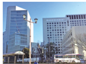
▲最寄り駅の四ツ谷駅から見た上智大学

学業面では、周囲の学生と国際教育に関する知識量の差があり、グループディスカッションで思うように発言できず苦しい時期がありましたが、読書や国際教育関連の講演会に参加するなどして理解を深め、乗り越えることができました。それは国内留学中に得たたく