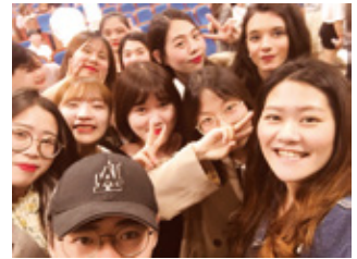
語学堂の仲間たちと

けてきた韓国の方々と英語の勉強を定期的にしたかったためです。活動内容としては主にTOEICの勉強、英会話の練習をグループで行っています。たまにイベントなどもあり、英語の上達だけではなく、韓国の方々との交流もすることができます。