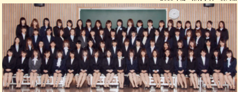
2018年度 保育学科 新入生

一般就職を考えた時期もありました。しかし、実習で子どもと接するうちに保育の魅力に気づき、最終的には子どもと関わる仕事をしたいと思い保育の道に進むことを決めました。現在、私の周りには一般就職を目指している人もいます。どちらの道に進むにしても言えることは4年生になった時に何か1つでも大学生活でやりきった、頑張ったと胸を張って言えるようなことを見つけることだと思います。それは大きな財産になると思いますので一生懸命取り組める事は何かを考え、挑戦してみてください。そうすると自分のやりたいことが徐々に見えてくると思います。皆さんが4年間の学生生活の中で自分のやりたいことを見つけられるよう応援しています。