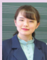
人間生活学部 保育学科 4年 I.Yさん

新海先生へのインタビューで一つの事に熱中し真剣に取り組むことは自分自身の将来の道を大きく切り開ききっかけになるという事を学ばせていただきました。残り少ない学生生活、目標をもって充実させたいと思います。