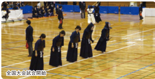
全国大会試合開始

試合では優勝校となった日本体育大学と一回戦で対戦し、実力の差を痛感しましたが、全国トップの強豪校と試合をしたことは選手にとって大きな刺激となり、北海道に戻ってからも熱の入った稽古を続けています。