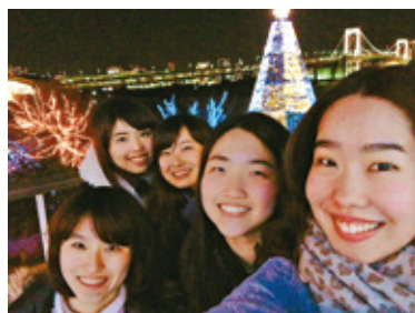
アルバイト先の友人たちと イルミネーションを見にお台場へ

私は2016年4月から1年間、国内留学生として上智大学総合人間科学部教育学科に所属し国際教育について学びました。国内留学を志したのは、本学で履修した教育に関する授業が興味深く、グローバルな上智大学であれば日本のみならず海外の教育事情を学べると