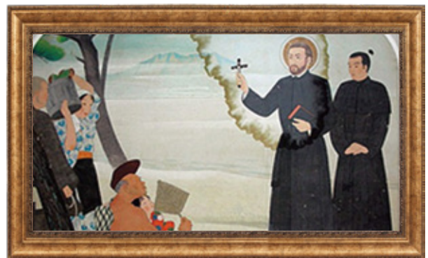
聖フランシスコ・ザビエル