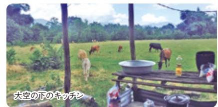
大空の下のキッチン

私は国際ボランティアNGO NICEのプログラムで、東南アジアのラオスとフィリピンのボランティアに参加してきました。ラオスでは、ガスや水道のない生活を送りながら、子供たちへの英語の教育や、水を貯めるタンクの設置等を行いました。