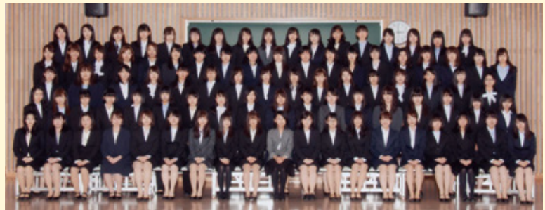
2018年度 食物栄養学科 新入生

多くの人にとって学業に専念できるのはこの4年間が最後です。アルバイトや友人と過ごす時間を息抜きにしながら、思う存分学びましょう。食物栄養学科にきて良かった!と思える場面が、これから日常でもたくさん出てくると思います。皆さんが素敵な藤女子ライフを送れますよう願っています。