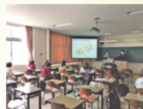
教職セミナーの様子

これから毎年北海道・札幌市の小学校、特別支援学校の教壇に多くの卒業生を輩出することにより、良き伝統が作られていくことを期待しています。