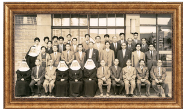
藤女子大学開設時の教師陣（短大の教師も一部含む）