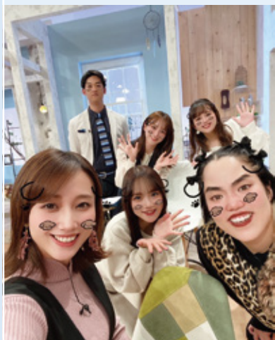
いっとこ!スタジオの様子。ゲストも来てくれます。

卒業後、テレビ局のアナウンサーとして働いています。入社1年目から5年目までは夕方の情報番組のMCなどを担当し、6年目からは、土曜に放送している情報番組「いっとこ!」のMCを務めています。アナウンサーは、「言葉で伝える仕事」です。刻々と変わっていく情報を伝えるという仕事は、新しいものに触れる刺激があり、沢山の人と出会えるとても楽しい仕事だと感じています。一方で、観ている人にしっかりと伝わるように言葉選びや伝え方を考えなければなりません。そこに難しさと奥深さを感じ、自分の中で悔しさをおぼえる時もありますが、観た人の発見になり、その時間だけでも明るい気持ちになってもらえるよう放送に向き合っています。また、大学時代は日本語学のゼミに所属し、言葉の研究をしていました。そんな私の好奇心をくみ取っていただけたのか、今は系列局の中で「放送で使用する用語」について考える仕事もさせてもらっています。全国各局のアナウンサーの方々と言葉について何時間も話し合うことは、アナウンサーの仕事ならではのかもしれません。稀有な経験を楽しめているのも、大学時代に言葉について学んでいた時間があったからだと思います。振り返ってみると、何が自分の将来に繋がっていくかわからないものだと日々感じています。学生時代に経験できる講義やサークル活動、アルバイト、何でも良いので少しでも興味を持ったことに飛び込んでいくことをお勧めしたいです。